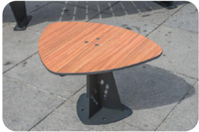
Table basse Slalom | JAN-0546